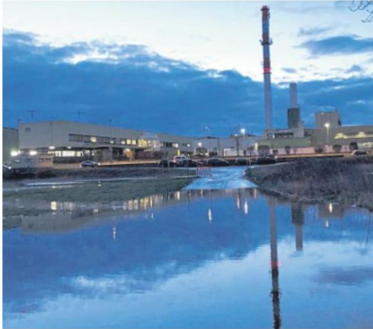
Aus die Maus: kein Durchkommen mehr zum Bad Kreuznacher Wertstoffhof am frühen Dienstagmorgen. Der Kreis reagierte und schloss die Anlage sofort.