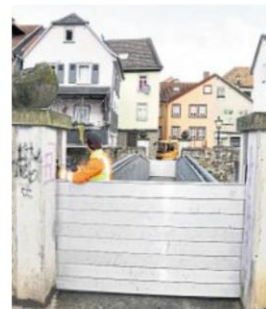
Stufe 2 in KH: Die Schutzwände auf dem Hombes-Briggelche stehen.

ständen kontrolliert. Die Weinsheimer behielten den Ellerbach bis Dienstagmorgen im Blick.