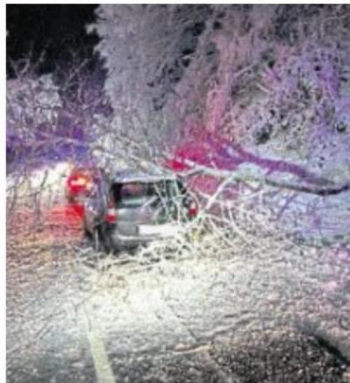
Zwischen Spabrücken und Münchwald fiel am Donnerstagabend ein Baum auf einen Kombi.

„Unsere Feuerwehren waren seit dem späten Nachmittag rund 40 Mal im Einsatz“, teilte der stellvertretende VG-Wehrleiter Jörn Trautmann mit. Die Einsätze dauerten bis zum späten Abend. Zwischen Spabrücken und Münchwald stürzte am Abend ein Baum auf einen Kombi. Die Fahrerin blieb bis auf einen Schock glücklicherweise unverletzt. Im Feuerwehrhaus in Bockenau waren bis zum frühen Abend rund 25 Autofahrer gestrandet, die ihre Fahrt Richtung Winterburg nicht mehr fortsetzen konnten. Die Bockenauer Kameraden versorgten die Fahrer während der Wartezeit.