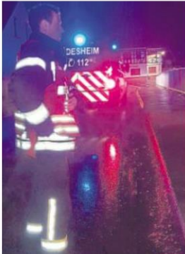
Auch die Bachläufe hatten die Wehren der VG Rüdesheim im Blick.