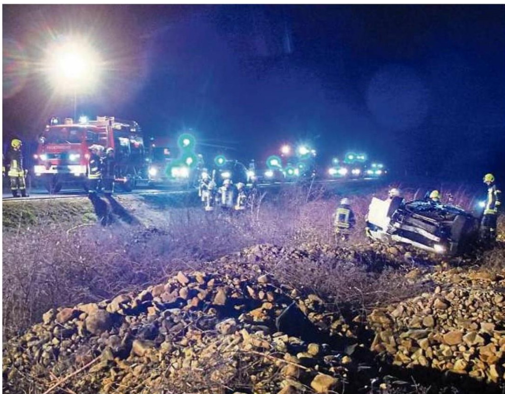
33 Feuerwehrleute, vier Polizisten sowie mehrere Notärzte und Rettungssanitäter waren in der Nacht von Samstag auf Sonntag an der K47 im Einsatz.

Da einer der Fahrzeuginsassen sich nicht mehr eigenständig aus dem Fahrzeug befreien konnte, forderte die bereits eingetroffene Polizei gegen 23.50 Uhr sowohl Feuerwehr als auch Rettungsdienst zur Hilfe an. Durch die zuerst eintreffenden Wehren aus Hergenfeld und Rüdeshheim wurde umgehend die Rückbank des Unfallautos weggeklappt, sodass die Beine des Mannes befreit werden konnten. Danach konnte der Verletzte eigenständig aus dem Auto