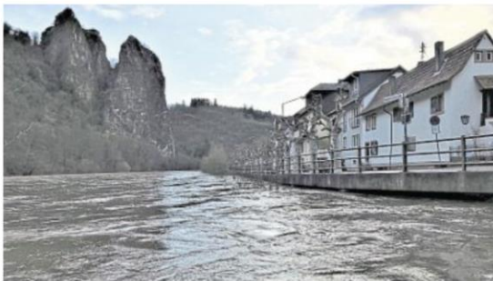
Knapp dran, aber diesmal kein Landunter am Kapitän-Lorenz-Ufer in Bad Münster am Stein-Ebernburg. Dieser Naheabschnitt ist von jeher fluterprobt.