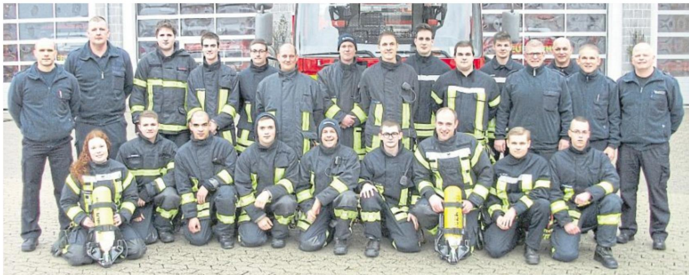
Die Teilnehmer des Lehrgangs freuen sich über die bestandenen Prüfungen.

Abgerundet wurde die Ausbildung durch das Erlernen der umfangreichen gerätetechnischen Theorie sowie der atemschutzspezifischen Ein-