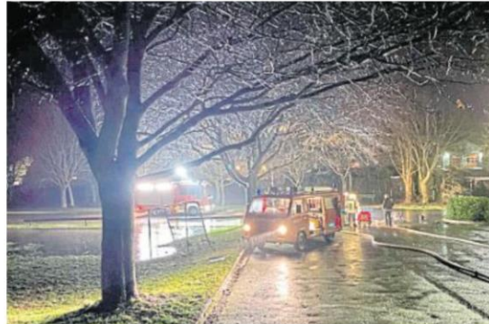
Nachteinsatz an der Norheimer Rotenfelshalle, an der sich ein kleiner See gebildet hatte.